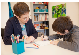
Abb. 2: Standortbestimmung

Auch im Jahr 2015 lag ein Schwerpunkt des ZEPP auf der Beratung von Eltern, welche die Entwicklung ihrer Kinder entsprechend ihren Bedürfnissen und Fähigkeiten fördern möchten. Die frühe Erkennung von Abweichungen von der Regelentwicklung sowie die Einleitung geeigneter Fördermassnahmen helfen, problematische Entwicklungsverläufe zu verhindern.