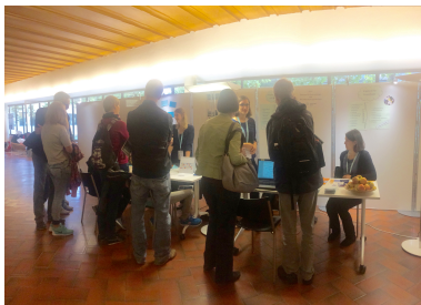
Abb. 3: ZEPP an der UniNacht

Im Jahr 2015 war das ZEPP bei verschiedenen Anlässen aktiv. Ein breit angelegter Anlass für die Öffentlichkeit war die Teilnahme des ZEPP an der Uni-Nacht am 18.09.2015.