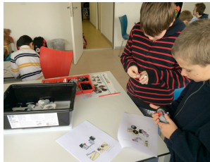
Abb. 5: Kinderkurs Roboter-Bau

Auch im Jahr 2015 wurden verschiedene Zusatzkurse für Kinder angeboten, u.a. zum kreativen Schreiben und zum Roboter-Bau. Neben der Vermittlung konkreter Inhalte stand dabei jeweils der Ausbau einer Schlüsselkompetenz wie Teamarbeit im Zentrum.